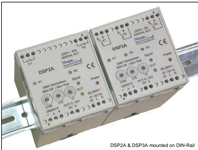
DSP2A & DSP3A mounted on DIN-Rail